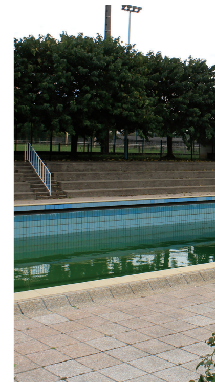
Photographie d'un des bassins de la piscine St Roch.

N'ont-ils pas, d'ailleurs, suivi récemment une voie identique en faisant tout pour que le camping municipal "coule" pour le céder ensuite à des intérêts privés.